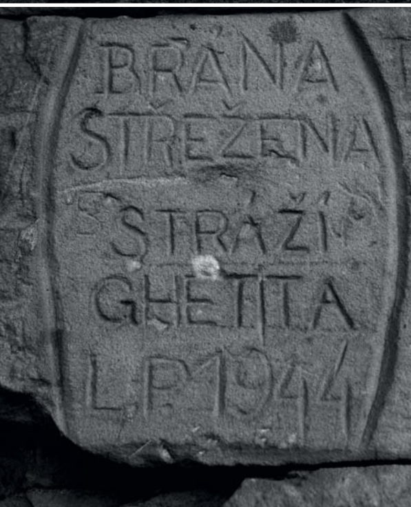
Terezín se svého stigmatu nezbaví