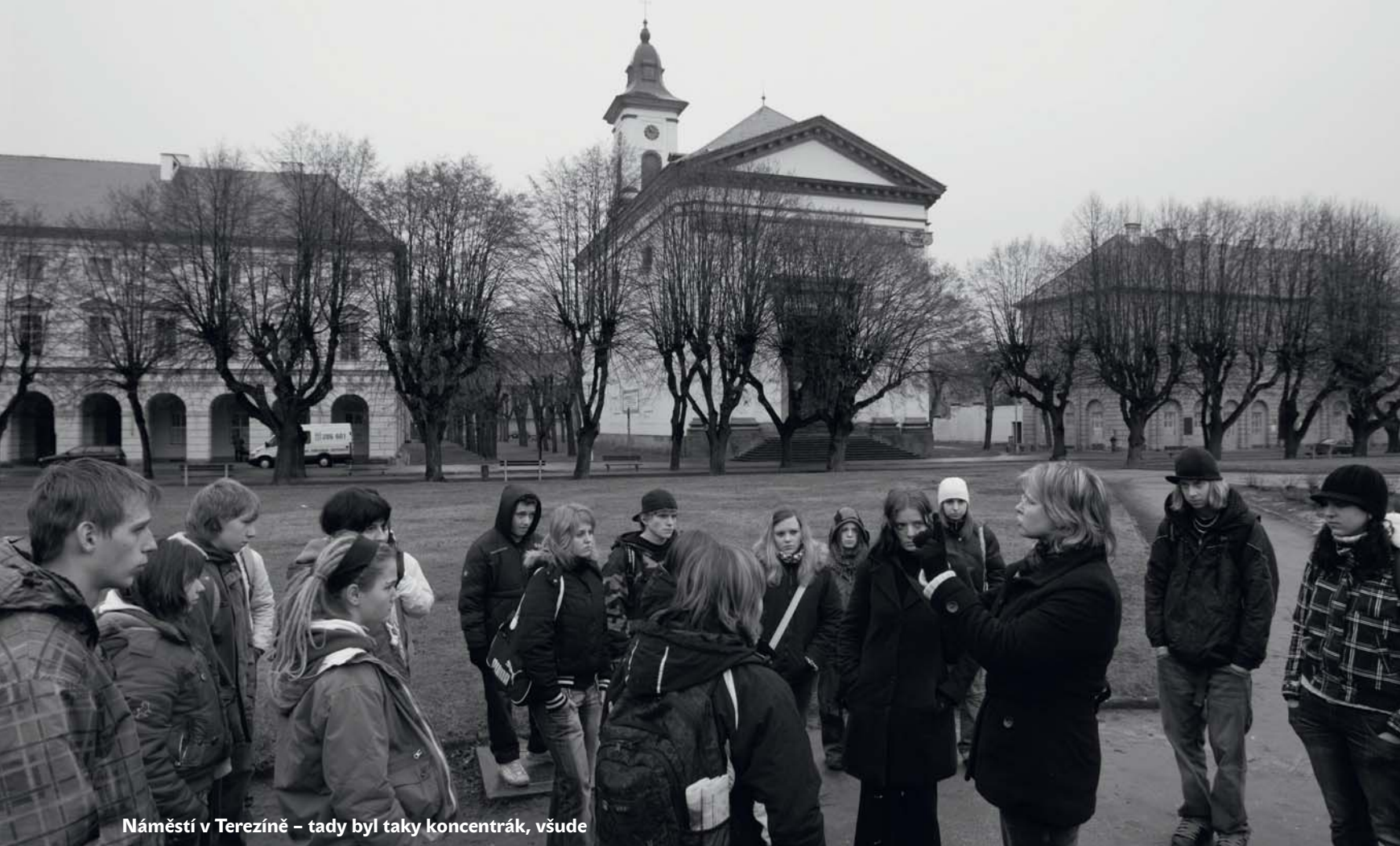
Náměstí v Terezíně – tady byl taky koncentrák, všude