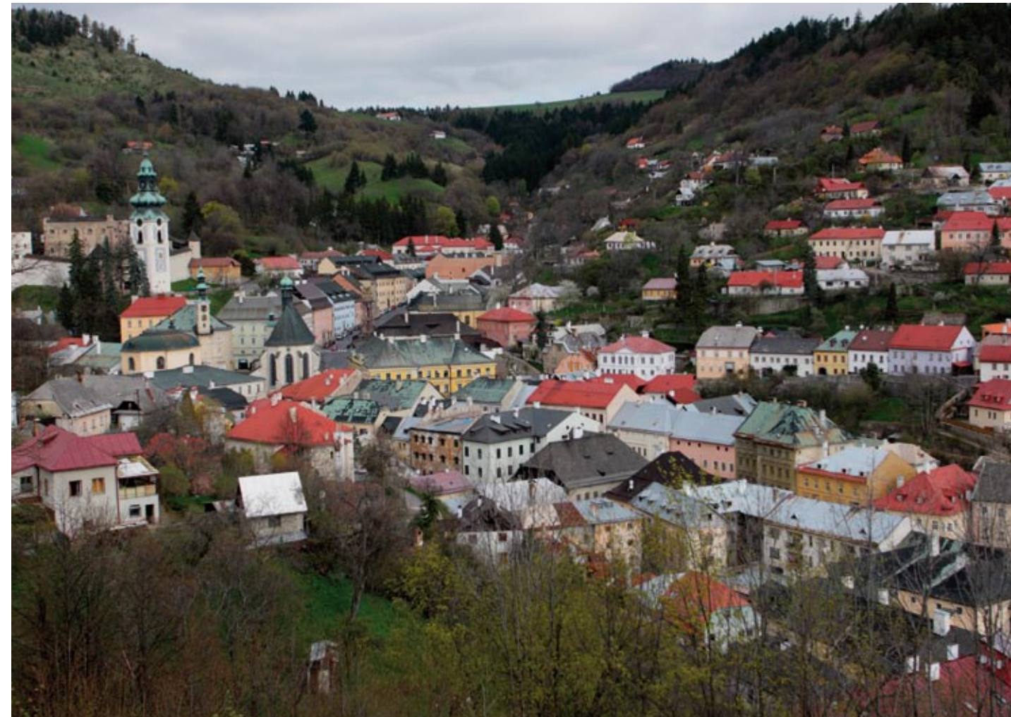
Město sevřené v údolí expanduje do strmých svahů