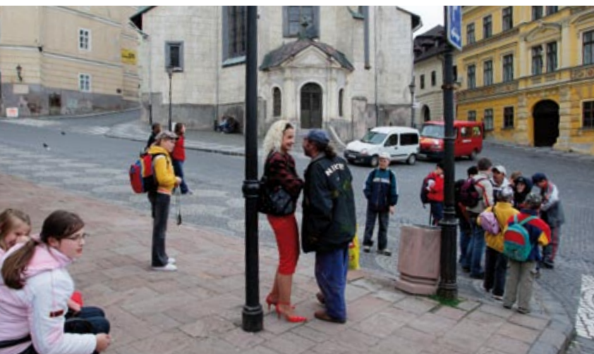
Až odjedou děti od školy, náměstí osiřl

Žíme se to zastavit, bude to běh na dlouhou trať.“ Tvrdou etapu transformace má město za sebou a objevují se pozitivní trendy. Vzniklo několik středních firem, nezaměstnanost se snižuje k snesitelným třinácti procentům. Horníci to uměli se dřevem a našli práci ve stavebních firmách. Ženy zase pracují ve službách nebo odolávají asijské konkurenci v textilních firmách. Průmyslová centra v okolí mají dokonce problém s náborem zaměstnanců. A černá můra investorů a logistických plánovačů – špatně dostupné město s komplikovaným terénem, které „nedobyli ani Turci“ – se nakonec stává výhodou. „Máme zájem o lidi mimo konzumní mainstream, kteří dávají přednost hezkému a klidnému prostředí před nákupními centry,“ vysvětluje novou strategii primátor. Kouzlo Štiavnice už objevili umělci, architekti, IT specialisté. Tedy lidé z profesí, kteří mohou pracovat díky internetu z domova. A ti ocení inspirující prostředí.