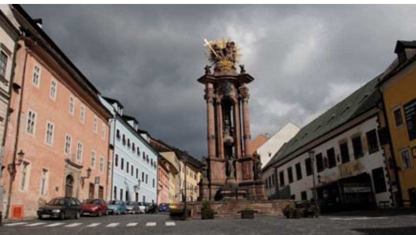
Trojúhelníkový půdorys náměstí sv. Trojice doplňuje nádherná vertikála barokního morového sloupu