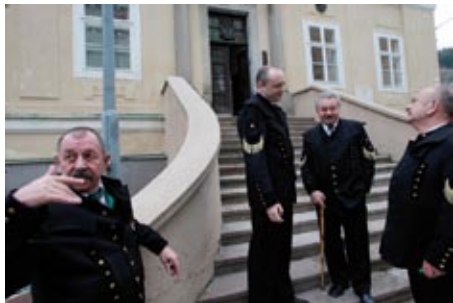
Palčivá otázka: Kdo bude nosit hornické uniformy za sto let?