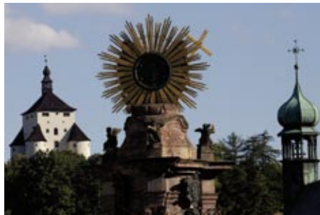
Nový zámek dominuje horizontu města, opevněním připomíná hrad