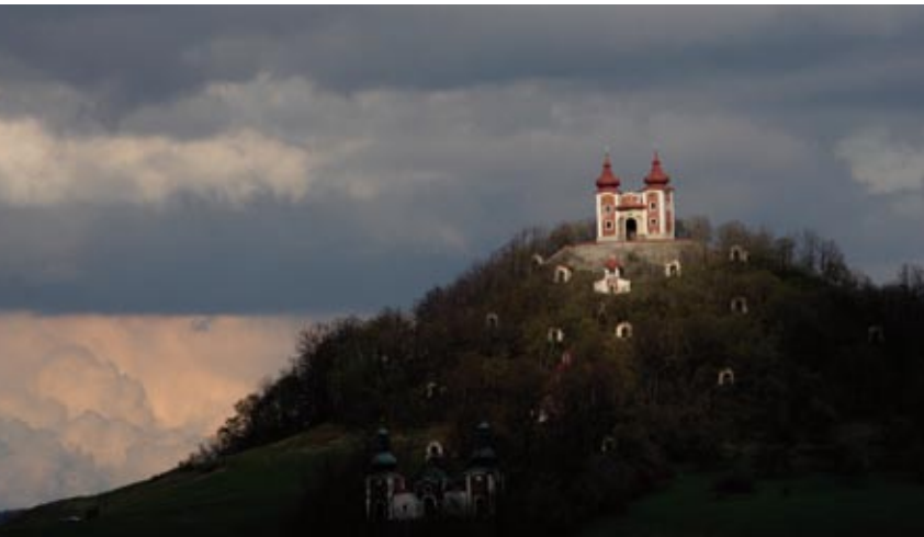
Barokní oblaka nad barokní Kalvárií